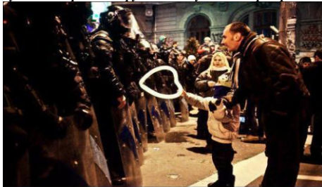
Румынский ребенок вручает воздушный шарик работнику полиции, во время протестов в Бухаресте.