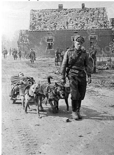
Собаки везут раненого, 1944 год.

Скрип тележки. Откуда-то слышится, как играет русская двухрядка. Три запряженные в небольшую тележку собаки везут раненого, во главе них идет солдат, зимняя шапка его немного сдвинута на бок, а на лице незаметная солдатская улыбка. Шел 1944 год.